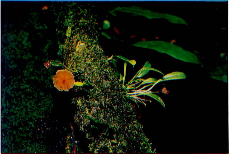
LEPANTHES TELIPOGONIFLORA Schuiteman & A. de Wilde.