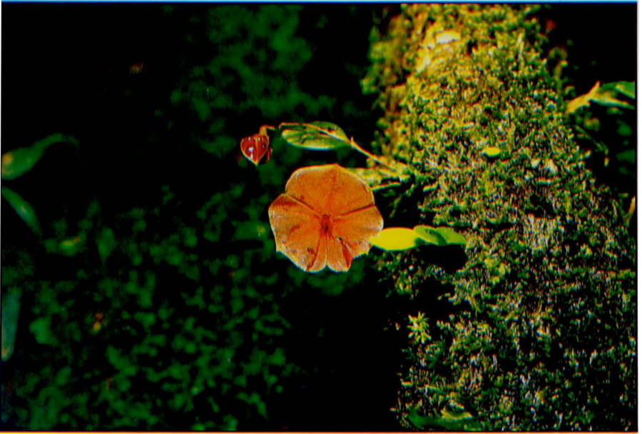
LEPANTHES TELIPOGONIFLORA Schuiteman & A. de Wilde.